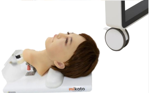
シングルタスクモデル