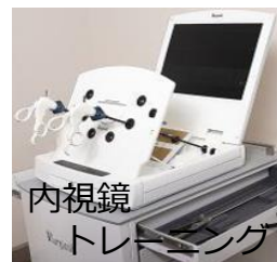
内視鏡 トレーニング