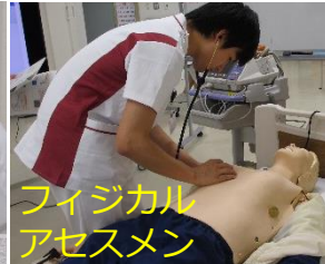
フィジカルアセスメン

採血・吸引・導尿・心電図などの新人研修をはじめ、呼吸・循環フィジカルアセスメント研修、各病棟自主トレーニングなど様々な目的でご利用いただいております