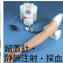
留置針・ 静脈注射・採血