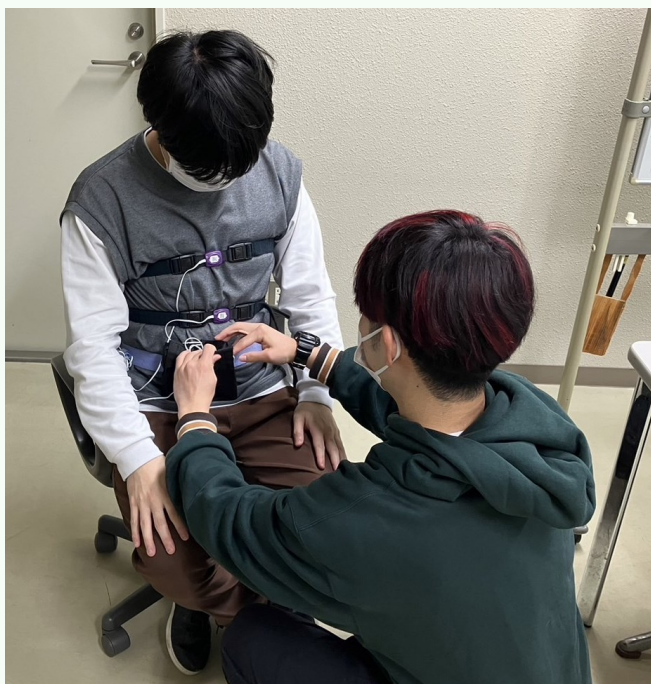
簡易ポリソムノグラフィ