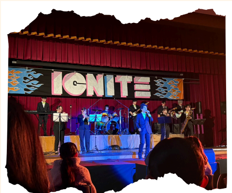
合同コンサート局