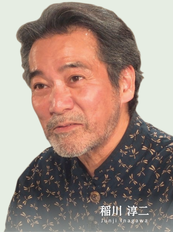
稲川 淳二 Junji Nagawa