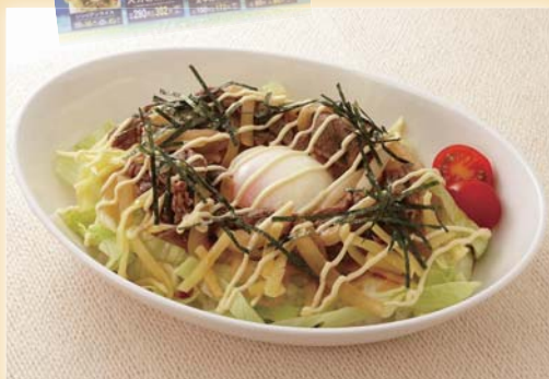
6月限定の『シリリアンライス』

生協食堂は、8月上旬から約3ヶ月間、改装工事のため閉店する。10月には装いも新たに、私達を迎えてくれることを楽しみに待ってよう。