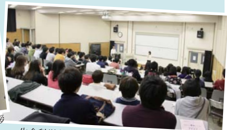
生命科学科全学生の前で自己紹介をする1年生