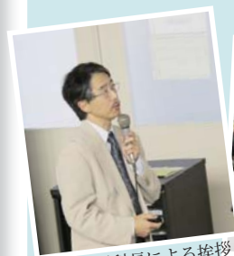
生命科学科長による挨拶

次いで、極めて顕著な業績を挙げた学科卒業生を対象に昨年度から設けられた生命科学科特別賞と奨励賞の授与式を行い、特別賞を受賞した奈良先端科学技術大学院大学の河合太郎准教授に講演をしていただいた。その夜は、生命科学科の学部学生・大学院生と教員のほぼ全員が一堂に会し、総勢200名を越える夕食・懇親会となった。