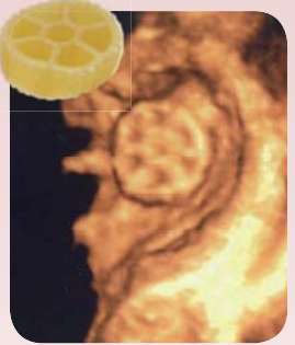
超音波による胃の中にあるマカロニの画像