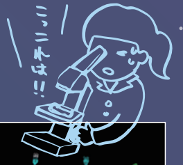
シリアンハムスターの染色体